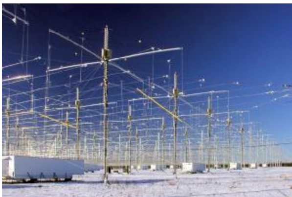
High Frequency Active Auroral Research Program, auch High Frequency Active Auroral Research Project